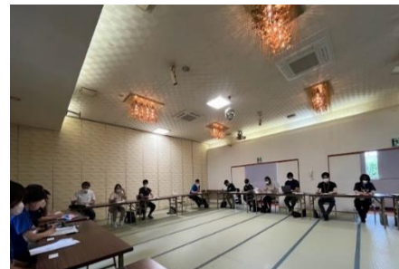
地域ネットワーク組織 下越ネット総会参加