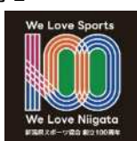
A 社は新潟県スポーツ協会創立 100 周年をお祝いします。