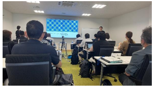
令和5年度 総合型地域スポーツクラブ 第2回クラブ支援ミーティング参加