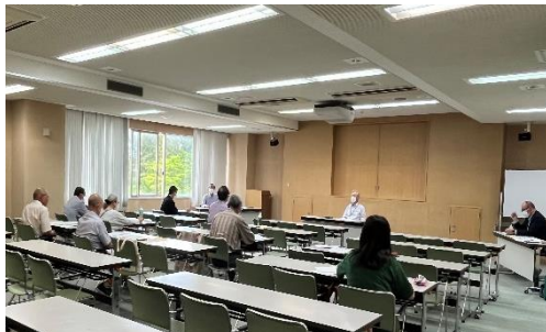
地域ネットワーク組織 上越SCネット総会参加